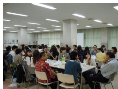
先生と保護者の歓談の様子

クラスごとに男子女子の保護者別や班別に着席し、先生方には各テーブルを回って話に加わっていただきました。先生から普段の子どもの様子や勉強の事をうかがい、保護者同士も会話が弾み、和やかで有意義な時間が過ごせました。どのクラスもとても良い雰囲気笑顔あふれる懇談会になりました。