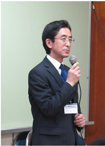
大井校長先生挨拶