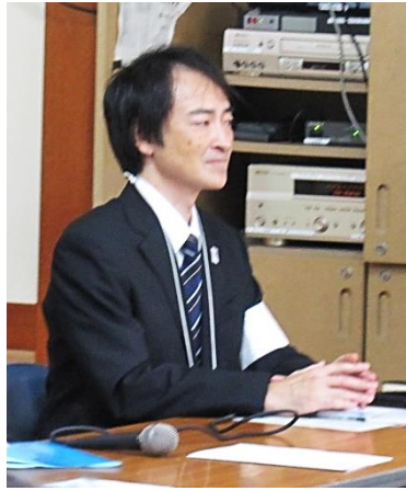
後援会 宝田会長挨拶