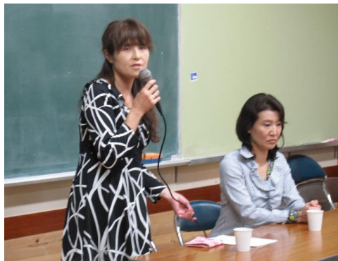
講演会でお話をして下さった、お母様方